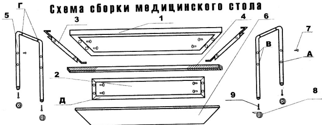
Схема сборки медицинского стола