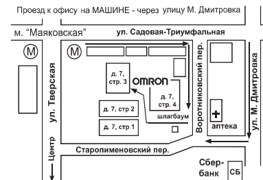
Схема расположения офиса

Официальным представителем OMRON Healthcare в России является ЗАО "КомплектСервис", 127006, Москва, Воротниковский пер., д. 7, стр. 3 (район м. "Маяковская"), тел.: (095) 299-40-64, 209-37-31, 209-92-39 e-mail: omron@dol.ru , www.omron-med.ru .