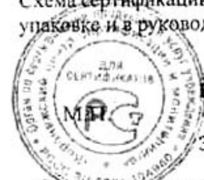
Схема сертификации: З. Маркировка знака соответствия по ГОСТ Р 50460-92 на изделии, упаковке и в руководстве по эксплуатации.