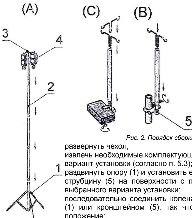
Рис. 2. Порядок сборки и варианты установки штатива.

6.1. Сборка штатива осуществляется стыковкой секций в следующей последовательности (Рис.2):