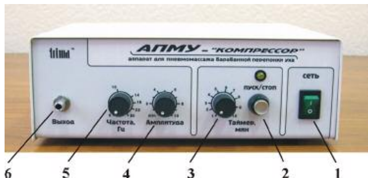
Рис.2 1 – Сетевой переключатель 2 – Кнопка "ПУСК/СТОП" для запуска процедуры и ее принудительной остановки с индикатором проведения процедуры 3 – Регулятор установки времени процедуры 4 – Регулятор амплитуды бароимпульсов 5 – Регулятор частоты следования бароимпульсов 6 – Выходной штуцер для подсоединения трубки с наконечником

После установки необходимого времени проведения процедуры и нажатия кнопки "ПУСК/СТОП" не рекомендуется поворачивать регулятор "ТАЙМЕР, МИН" , т.к. при этом может произойти сбой в работе таймера и работа аппарата в течение ранее установленного времени в этом случае не гарантируется.