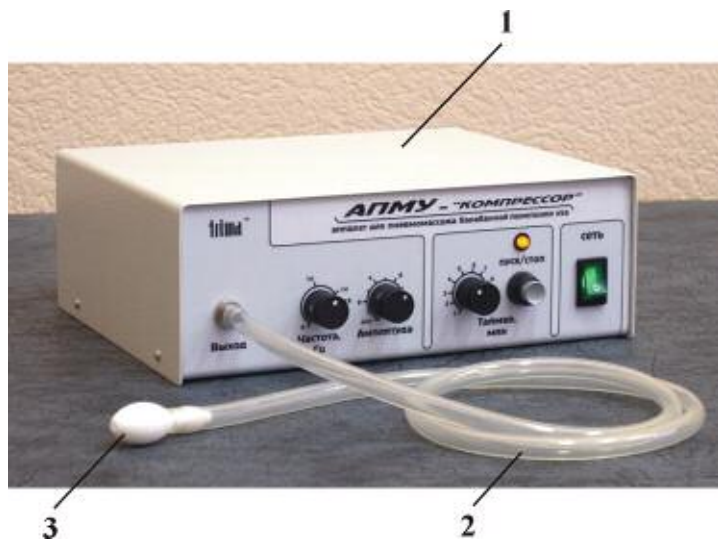
Рис.1. 1 – электронный блок аппарата 2 – соединительная трубка 3 – оливообразный наконечник

Общий вид аппарата приведен на Рис.1. На переднюю панель аппарата выведены следующие органы управления. Справа расположен сетевой переключатель для включения аппарата в работу и его отключения. Переключатель снабжен клавишей с подсветкой, индицирующей включенное состояние аппарата. Левее переключателя расположены органы управления таймером –кнопка "ПУСК/СТОП" для запуска аппарата в работу и принудительной остановки процедуры раньше установленного времени, регулятор установки времени процедуры, снабженный лимбом с градуировкой от 1 до 10 мин с дискретностью через 1 мин и соответствующий индикатор работы аппарата.