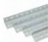
завальцованный край увеличивает жёсткость стойки